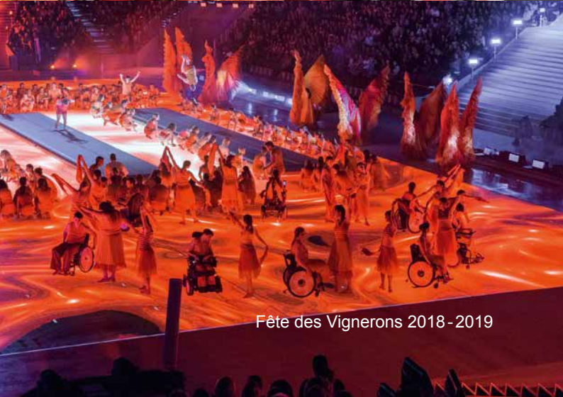
Fête des Vignerons 2018-2019