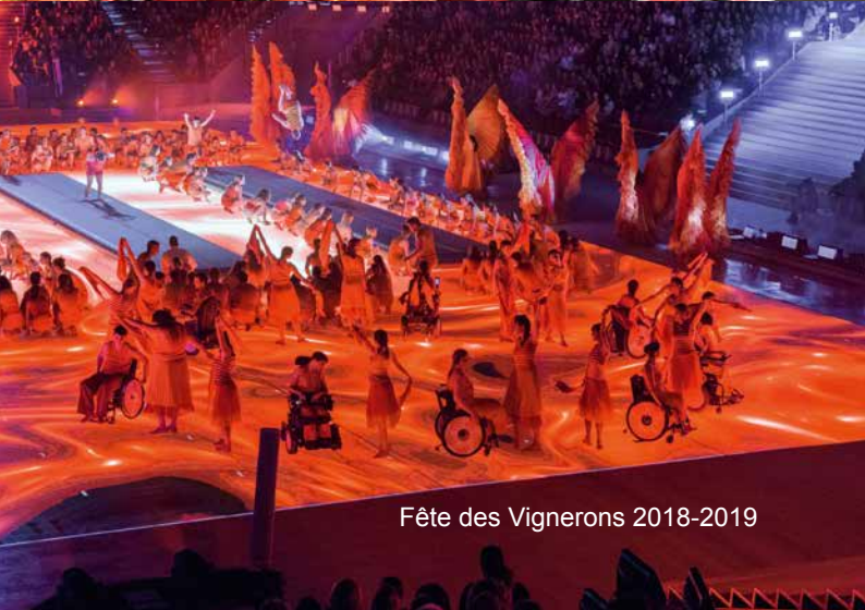
Fête des Vignerons 2018-2019